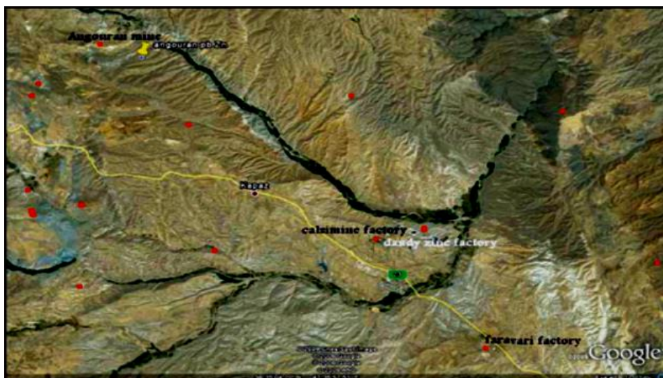
شکل (۲): جانمایی صنایع معدنی سرب و روی منطقه (نقاط قرمز رنگ) بر روی تصویر ارسالی گوگل، ۲۰۰۹.

شکل ۲ جانمایی صنایع معدنی سرب و روی در منطقه مورد مطالعه را نشان می‌دهد. همان‌طور که در شکل قابل مشاهده است دلیل انتخاب این منطقه برای بررسی کیفیت آب زیرزمینی وجود معدن سرب و روی انگوران و صنایع وابسته به آن در این منطقه و بررسی تأثیر بخشی از این فعالیت‌ها بر کیفیت منابع آب زیرزمینی چند روستا در منطقه بود.