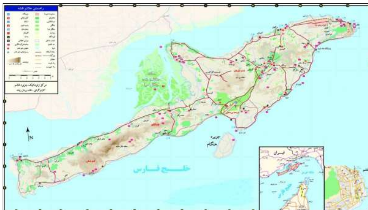
نقشه شماره ۳- موقعیت جغرافیایی خلیج فارس

جزیره قشم با وسعت ۱۵۰۰ کیلومتر مربع (۱/۰ درصد مساحت کشور) و ۲۶۰ کیلومتر ساحل (حدود یک درصد طول سواحل آبی کشور) و بیش از یکصد هزار نفر جمعیت، به راحتی می‌تواند با بهره‌گیری از اصول صحیح آمایش سرزمین و توسعه پایدار، سالانه پذیرای بیش از ۳ تا ۴ میلیون نفر مسافر داخلی و هزاران مسافر خارجی از منطقه آسیای میانه، حاشیه دریای خزر، ارمنستان و گرجستان در فصول پاییز و زمستان به صورت بازدید روزانه، ترانزیت و اقامت شبانه یا چند روزه باشد. آمایش حمل و نقل و گردشگری جزیره قشم نیاز به توجه جدی و عمیق به ابعاد مختلف سیاسی، امنیتی، اقتصادی، فرهنگی، اجتماعی، زیست محیطی و فنی- مهندسی دارد.