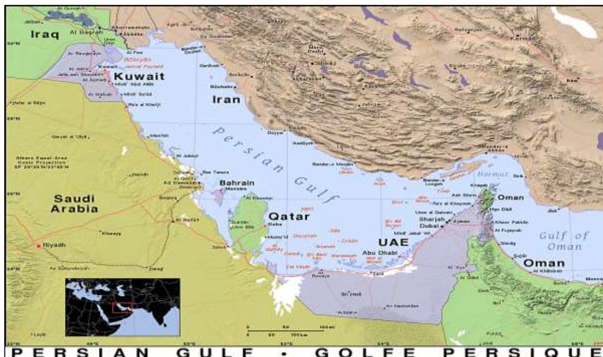
نقشه شماره ۱- موقعیت خلیج فارس و جزیره قشم

خلیج فارس ۲۳۷۴۷۳ کیلومتر مربع است و پس از خلیج مکزیک و خلیج هادسون سومین خلیج بزرگ جهان بشمار می‌آید. خلیج فارس از شرق از طریق تنگه هرمز و دریای عمان به اقیانوس هند و دریای عرب راه دارد و از غرب به دلتای رودخانه اروندرود که حاصل پیوند دو رودخانه دجله و فرات و پیوستن رود کارون به آن است، ختم می‌شود (قراگزلو، ۱۳۷۹: ۵۳).