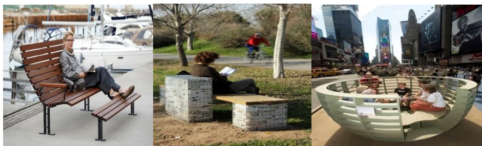
شکل ۳: گزینه مطلوب از نظر زنان خانه‌دار شکل ۴: گزینه نامطلوب از نظر هر دو گروه شکل ۵: گزینه مطلوب از نظر مردان منبع: نگارندگان

تحلیل و بررسی نحوه طراحی فرم نیمکت‌ها در پارک بانوان: این سؤال با فرض بر اینکه با نظر به علم روانشناسی در خصوص تفاوت‌های میان مردان و زنان، زنان بیشتر به روابط بین فردی متمایل بوده و حتی در تعریف خود بر روابط با دیگران متمرکز می‌شوند اما مردان سکوت را دوست دارند و به تنهایی به حل مسائل خود می‌پردازند تدوین شده است؛ می‌توان تصور کرد که زنان بیشتر تمایل به استفاده از نیمکت‌های تجمعی و راحت داشته باشند اما مردان از نیمکت‌های انفرادی استفاده کنند بر اساس نتایج، بیشترین امتیاز میزان تمایل مردان از نوع نیمکت‌ها مربوط به نیمکت‌های راحتی با پشتی و جای پا (شکل ۵) با میانگین وزنی ۱۴/۵ و کمترین تمایل را به نیمکت‌های کتابدار (شکل ۴) با میانگین وزنی ۶/۶ دارند؛ همچنین برای زنان خانه‌دار بیشترین امتیاز مربوط به فرم نیمکت‌های تجمعی (شکل ۳) با میانگین وزنی ۱۶/۳۵ است و کمترین امتیاز برای زنان خانه‌دار نیز مربوط به نیمکت‌های کتابدار (شکل ۴) با میانگین وزنی ۹/۲۵ است، پس می‌توان عنوان کرد که زنان خانه‌دار به فرم نیمکت‌های تجمعی بیشتر علاقه‌مند می‌باشند، چراکه این‌گونه نشستن‌ها افراد را به تأمل در نشستن و سپری کردن اوقات خود با هم‌جنسان و صحبت کردن با آسودگی خاطر در محیط پارک تشویق می‌کنند؛ همچنین به علت کوتاه بودن قد اکثر بانوان ایرانی بهتر است در طراحی از پایین‌ترین عدد استاندارد (۴۳ سانتیمتر) در ارتفاع صندلی استفاده شود و به علت وزن بالای بیشتر بانوان مناسب است از نشیمنگاه با جنس نرم و عرض مناسب طراحی شود تا در ناحیه کمر و بازو احساس درد و فشار نکنند و مردان بیشتر به راحتی و انفرادی بودن نیمکت‌ها برای داشتن امکان خلوت‌گزینی در انتخاب خود توجه می‌کنند.