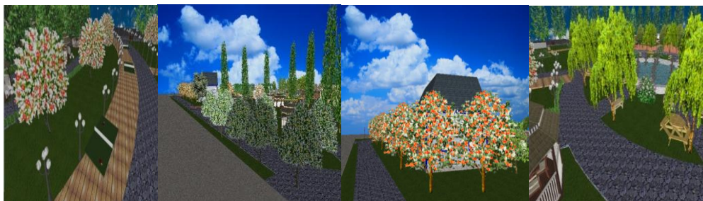
شکل ۲۰: گزینه مطلوب (مردان) شکل ۲۱: گزینه مطلوب (زنان خانه‌دار) شکل ۲۲: گزینه نامطلوب (مردان) شکل ۲۳: گزینه نامطلوب (زنان خانه‌دار) منبع: نگارندگان

تحلیل و بررسی نحوه طراحی فرم سطل‌های زباله در پارک بانوان: این سؤال با فرض اینکه افراد بیشتر تمایل به استفاده از سطل‌های زباله با اشکال هندسی ساده و سطل‌های زباله تفکیک‌شده داشته باشند و به‌طورکلی فرم، مواد و رنگ زباله‌دان حتی‌الامکان باید با سایر مبلمان موجود هماهنگ باشد و اشکال مدور و هندسی ساده به‌ویژه چهارگوش ارجحیت دارند؛ تدوین‌شده است. سطل‌های زباله با اشکال هندسی ساده (شکل ۲۵) در بین گروه مردان با میانگین وزنی ۱۴/۶۵ بیشترین امتیاز و سطل‌های زباله شیاردار (شکل ۲۷) با میانگین وزنی ۱۱،۶۵ کمترین امتیاز را کسب کرده است و در بین گروه‌های زنان خانه‌دار سطل‌های زباله تفکیک‌شده با رنگ‌های متنوع (شکل ۲۶) با میانگین وزنی ۱۵/۲ بیشترین امتیاز را کسب کرده و سطل‌های زباله با شکل‌های انتزاعی (شکل ۲۴) با میانگین وزنی ۱۱/۵ کمترین امتیاز را کسب کرده است؛ به‌طورکلی توجه به مواردی همچون: استقامت و دوام، موارد ضد حریق زنگ، مقاوم در برابر آلودگی، داشتن سطح پر از منفذ دریچه برای ریختن زباله درون سطل، بزرگی سطل، که بستگی به میزان استفاده و محل قرار گرفتن سطل دارد، جنس سطل زباله، استفاده از سطل‌های زباله تفکیک‌شده، در هنگام ساخت سطل‌های زباله باید در نظر گرفته شود؛ همچنین با توجه به نتایج به‌دست‌آمده زنان خانه‌دار بیشتر تمایل به سطل‌های زباله تفکیک‌شده در رنگ‌های متنوع دارند.