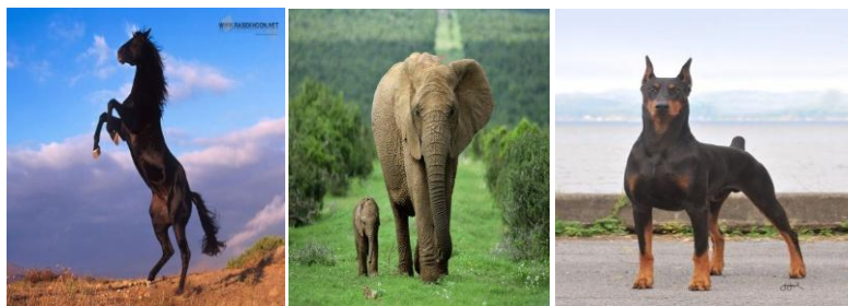
شکل ۸: گزینه نامطلوب برای زنان خانه‌دار شکل ۹: گزینه نامطلوب برای مردان شکل ۱۰: گزینه مطلوب برای هردو گروه

بررسی و تحلیل انتخاب نوع حیوانات برای جانمایی المان (مجسمه) در پارک بانوان: این سؤال با فرض بر اینکه زنان عاطفی‌تر و هیجانی‌تر از مردان بوده و نوسان‌های عاطفی و هیجانی بیشتری نسبت به مردان دارند و همچنین در صحنه زندگی اجتماعی، زنان بیشتر تساوی طلب هستند و همدردی، همدلی و لطافت بیشتری از مردان دارند، اما مردان برتری طلب و مبارزه‌جو بوده و برای برتری خود، بیشتر تلاش می‌کنند، پس این انتظار می‌رود که زنان خانه‌دار نسبت به انتخاب حیوانات اهلی تمایل بیشتری داشته باشند و مردان به دلیل حس برتری طلب و مبارزه‌جو نسبت به حیوانات وحشی تمایل بیشتری داشته باشند؛ با توجه به نتایج، هر دو گروه مورد مطالعه به حیوان اسب (شکل ۱۰) بیشترین امتیاز را داده‌اند که به ترتیب برای مردان با میانگین وزنی ۱۵/۲ و برای زنان خانه‌دار با میانگین وزنی ۱۵/۶ است و همچنین مردان کمترین امتیاز را با میانگین وزنی ۹/۶۵ به حیوان فیل (شکل ۹) داده‌اند و زنان خانه‌دار کمترین امتیاز را با میانگین وزنی ۵/۵۵ به حیوان سگ (شکل ۸) داده‌اند در کل می‌توان چنین استنباط کرد که زنان برای انتخاب خود از نوع حیوان برای المان به زیبایی توجه می‌کنند (طاووس و آهو، عقاب پس از اسب بیشترین امتیازها را آورده‌اند و سگ، گرگ و ببر، شیر کمترین امتیاز را کسب کرده است) و برای مردان تصاویر شیر و ببر بعد از اسب بیشترین مطلوبیت را داشته است؛ بنابراین از این نظر که اسب نمادی از تک‌تازی را برای مردان تداعی‌گر است و در خصوص زنان از لحاظ تمایل این گروه به زیبایی‌شناسی به نظر می‌رسد که اسب مطلوبیت بیشتری در بین دو گروه داشته است.