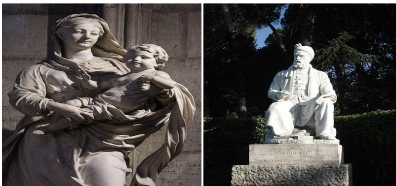
شکل ۱۱: گزینه نامطلوب از نظر هردو گروه شکل ۱۲: گزینه مطلوب از نظر هردو گروه

تحلیل و بررسی انتخاب نشانه‌های تجسمی برای المان در پارک بانوان: این سؤال با فرض اینکه المان‌ها توسط خصوصیات و نقش کالبدی و نوع کاربری پارک تعریف می‌شوند و با توجه به اینکه هدف نهایی طرح تعیین الگوهای مناسب برای پارک بانوان است، پس برای القای مفهوم و نوع کاربری پارک بانوان ساخت المان‌هایی با مفهوم مادر و دختر مناسب به نظر می‌رسد؛ در میان گروه مردان المان مادر (شکل ۱۲) با میانگین وزنی ۱۹/۸ بیشترین امتیاز را کسب کرده و المان مشاهیر (شکل ۱۱) با میانگین وزنی ۱۱/۵ کمترین امتیاز را کسب کرده است. همچنین در میان گروه زنان خانه‌دار نیز المان مادر با میانگین وزنی ۱۷/۰۵ بیشترین امتیاز را کسب کرده همین‌طور المان مشاهیر با میانگین وزنی ۹/۴ کمترین امتیاز را دارد؛ المان‌ها با مصالح ساختمانی مختلف برحسب شکل و فرم مجسمه حیوانات، پرندگان، انسان ساخته می‌رود که به‌عنوان سمبل یا رساندن منظوری بکار می‌رود بنابراین نشانه تجسمی با موضوع مادر مناسب‌ترین گزینه برای انتخاب المان در پارک بانوان است.