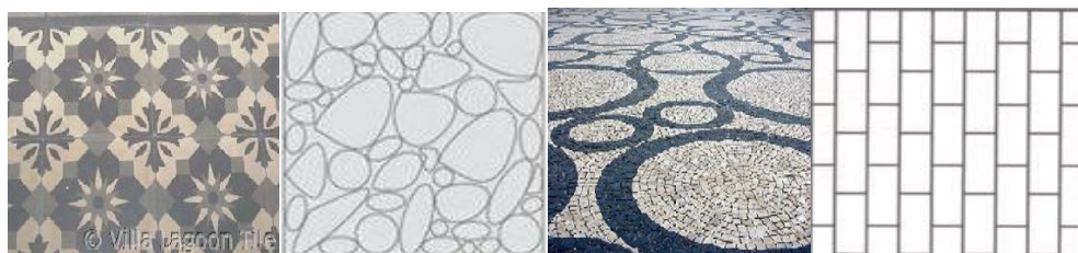
شکل ۱۳: گزینه نامطلوب (زنان خانه‌دار) شکل ۱۴: گزینه مطلوب (مردان) شکل ۱۵: گزینه مطلوب (زنان خانه‌دار) شکل ۱۶: گزینه نامطلوب (مردان)

تحلیل و بررسی انتخاب طرح و شکل کف‌پوش در پارک بانوان: این سؤال با فرض اینکه مردان به خاطر روحیاتی از قبیل اصول‌گرایی، محافظه‌کار بودن و خواستار نظم و ترتیب بیشتر اشکال هندسی مشخص را مطلوب می‌دانند اما زنان به خاطر داشتن روحیات لطیف، خلاقیت و حس برون‌گرایی و نیاز به هم‌صحبتی و اهمیت دادن به روابط بینابینی بیشتر به اشکال منحنی و دایره‌وار و گل‌دار علاقه‌مند باشند، تدوین شده است که با توجه به نتایج اشکال دایره‌ای شکل (شکل ۱۴) در بین گروه‌های مردان با میانگین وزنی ۱۶/۶ و اشکال گل‌دار (شکل ۱۶) با میانگین وزنی ۷/۷ کمترین امتیاز را کسب کرده است؛ همچنین اشکال منحنی شکل (شکل ۱۵) با میانگین وزنی ۱۳ در بین زنان خانه‌دار بیشترین امتیاز را دارد اشکال منظم مستطیلی (شکل ۱۳) ۷/۳ کمترین امتیاز را کسب کرده است؛ بنابراین اشکال منحنی برای بانوان خانه‌دار دارای مطلوبیت بیشتری است.