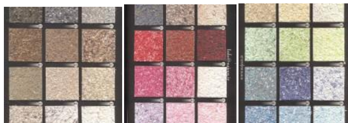
شکل ۱۷: گزینه نامطلوب (زنان خانه‌دار) شکل ۱۸: گزینه نامطلوب (مردان) شکل ۱۹: گزینه مطلوب (هر دو گروه)

تحلیل و بررسی انتخاب رنگ کفپوش‌ها در پارک بانوان: این سؤال با فرض اینکه زنان بیشتر به طیف رنگ‌های شاد و گرم تمایل داشته باشند و مردان بیشتری طیف رنگ‌های خاکی و سرد را انتخاب کنند تدوین گشته است؛ نتایج حاصل از پرسشنامه طیف رنگ‌های خاکی (شکل ۱۹) در بین گروه مردان و زنان خانه‌دار به ترتیب برای مردان با میانگین وزنی ۱۵/۶۵ و زنان خانه‌دار با میانگین وزنی ۱۳/۵ بیشترین امتیاز را کسب کرده و طیف رنگ‌های گرم (شکل ۱۸) برای مردان با میانگین وزنی ۱۲/۷۵ کمترین امتیاز را کسب کرده و طیف رنگ‌های سرد (شکل ۱۷) برای زنان خانه‌دار با میانگین وزنی ۱۰/۳ کمترین امتیاز را دارد. مسیرها در یک طرح منظر، استخوان‌بندی طرح را تشکیل می‌دهند. می‌توان بانوان را با مسیرهایی بارنگ‌های مشخص به کاربری‌های مختلف هدایت کرد برای مثال هدایت به چند نقطه کانونی مانند یک مجسمه تاریخی، یک درخت کهن سال چند صدساله، موزه غیره؛ بهتر است استفاده از تغییر رنگ یا بافت (کفپوش‌هایی با اشکال منحنی) در محل‌های تغییر مسیر و یا فضاهای مکث به ایجاد زیبایی بصری و شناسایی بهتر تغییر کارکردها کمک می‌کند..