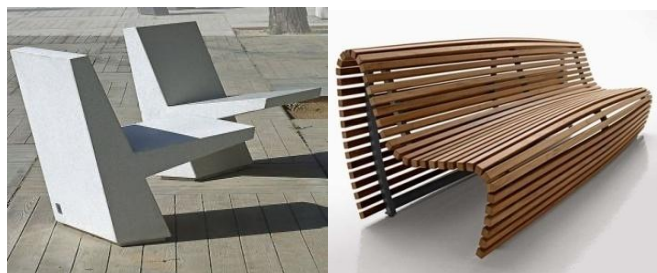
شکل ۶: گزینه مطلوب از نظر هردو گروه شکل ۷: گزینه نامطلوب از نظر هردو گروه

است؛ در بین گروه مردان جنس چوب (شکل ۶) با میانگین ۱۶/۱۵ بیشترین امتیاز را کسب کرده است و جنس سیمانی (شکل ۷) با میانگین وزنی ۶/۴ کمترین امتیاز را دارد؛ همچنین در بین گروه زنان خانه‌دار نیز جنس چوبی (شکل ۶) با کسب میانگین وزنی ۱۷/۳۵ بیشترین امتیاز و جنس سیمانی (شکل ۷) با میانگین وزنی ۵/۹ کمترین امتیاز را دارد، پس نیمکت‌های سیمانی، فلزی و پلاستیکی در مقایسه با نیمکت چوبی از نظر هردو گروه نامناسب‌ترین جنس برای طراحی نیمکت‌ها می‌باشند؛