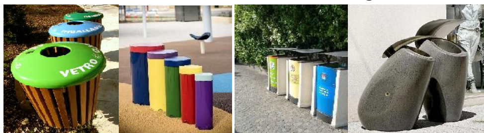
شکل ۲۴: گزینه نامطلوب (زنان خانه‌دار) شکل ۲۵: گزینه مطلوب (مردان) شکل ۲۶: گزینه مطلوب (زنان خانه‌دار) شکل ۲۷: گزینه نامطلوب (مردان). منبع: نگارندگان

تحلیل و بررسی نحوه طراحی فرم سطل‌های زباله در پارک بانوان: این سؤال با فرض اینکه افراد بیشتر تمایل به استفاده از سطل‌های زباله با اشکال هندسی ساده و سطل‌های زباله تفکیک‌شده داشته باشند و به‌طورکلی فرم، مواد و رنگ زباله‌دان حتی‌الامکان باید با سایر مبلمان موجود هماهنگ باشد و اشکال مدور و هندسی ساده به‌ویژه چهارگوش ارجحیت دارند؛ تدوین‌شده است. سطل‌های زباله با اشکال هندسی ساده (شکل ۲۵) در بین گروه مردان با میانگین وزنی ۱۴/۶۵ بیشترین امتیاز و سطل‌های زباله شیاردار (شکل ۲۷) با میانگین وزنی ۱۱،۶۵ کمترین امتیاز را کسب کرده است و در بین گروه‌های زنان خانه‌دار سطل‌های زباله تفکیک‌شده با رنگ‌های متنوع (شکل ۲۶) با میانگین وزنی ۱۵/۲ بیشترین امتیاز را کسب کرده و سطل‌های زباله با شکل‌های انتزاعی (شکل ۲۴) با میانگین وزنی ۱۱/۵ کمترین امتیاز را کسب کرده است؛ به‌طورکلی توجه به مواردی همچون: استقامت و دوام، موارد ضد حریق زنگ، مقاوم در برابر آلودگی، داشتن سطح پر از منفذ دریچه برای ریختن زباله درون سطل، بزرگی سطل، که بستگی به میزان استفاده و محل قرار گرفتن سطل دارد، جنس سطل زباله، استفاده از سطل‌های زباله تفکیک‌شده، در هنگام ساخت سطل‌های زباله باید در نظر گرفته شود؛ همچنین با توجه به نتایج به‌دست‌آمده زنان خانه‌دار بیشتر تمایل به سطل‌های زباله تفکیک‌شده در رنگ‌های متنوع دارند.