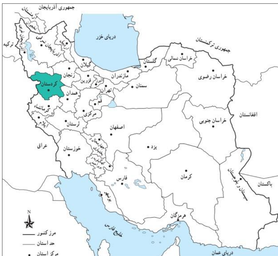
تصویر شماره ۱: موقعیت استان کردستان در کشور