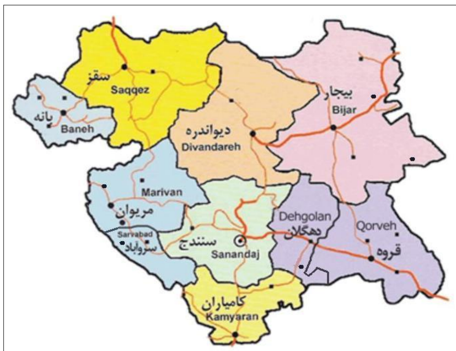
تصویر شماره ۲: موقعیت شهرستان‌های استان کردستان