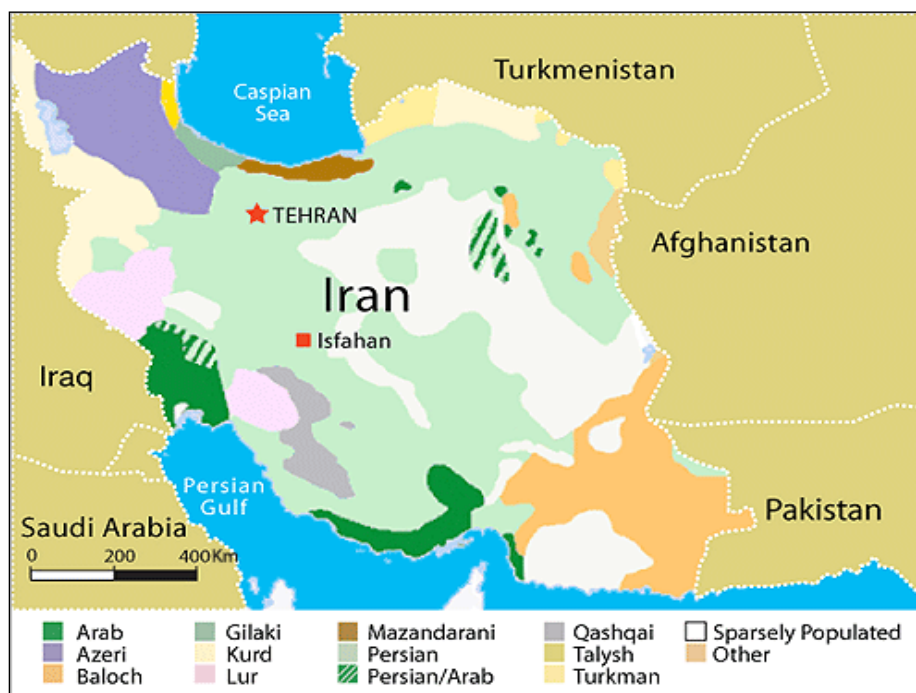
نقشه ۱: استان‌های عرب نشین ایران

چهار استانی که عرب‌های ایران بیشترین حضور را در آن‌ها دارند، خوزستان، هرمزگان و بوشهر و ایلام هستند. تا سال ۱۳۵۷ عرب‌زبان‌های ایرانی ۱/۵۳ درصد از جمعیت ایران را شامل می‌شدند.