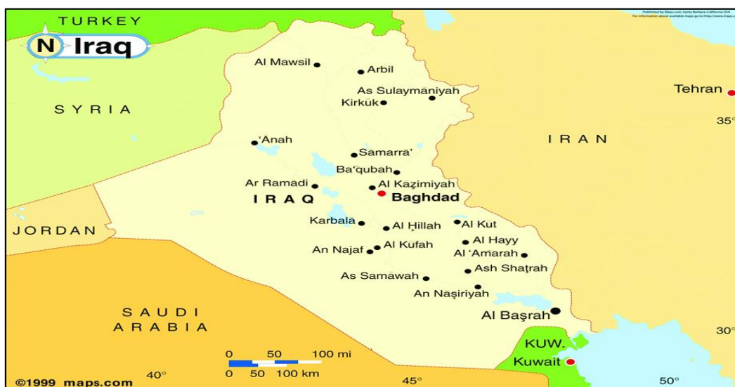
نقشه ۳: موقعیت کشور عراق

سه بادیه (منطقه صحرائی) تقسیم می‌شود. شهرهای عمده آن عبارتند از: بغداد، موصل، بصره، کرکوک، کربلا، نجف، حلّه، ناصریه، سلیمانیه. عراق با ۳۲۵۸۵۶۹۲ نفر (آمار ژوئیه ۲۰۱۴) جمعیت چهارمین کشور پرجمعیت جهان است. عرب‌ها ۷۵ درصد-۸۰ درصد، کردها ۱۵ درصد-۲۰ درصد، ترکمنان، آشوریان و غیره نزدیک ۵ درصد از جمعیت عراق را تشکیل می‌دهند. همچنین حدود ۶۰ درصد-۶۵ درصد مردم عراق شیعه، ۳۲ درصد-۳۷ درصد سنی و ۳ درصد مسیحی و پیروان دیگر ادیان هستند.