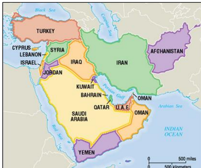
نقشه ۲: کشور ایران

ایران با ۱۶۴۸۱۹۵ کیلومتر مربع وسعت (هفدهم درجهان) و بر پایه سرشماری سال ۱۳۹۵ دارای ۷۹۹۲۶۲۷۰ نفر جمعیت (هفدهم درجهان) است. ایران از شمال با جمهوری آذربایجان، ارمنستان و ترکمنستان، از شرق با افغانستان و پاکستان و از غرب با ترکیه و عراق همسایه است و همچنین از شمال به دریای خزر (کاسپین) و از جنوب به خلیج فارس و دریای عمان محدود می‌شود، که دو منطقه نخست از مناطق مهم استخراج نفت و گاز در جهان هستند. ایران در قلب خاورمیانه همچون پلی دریای مازندران بزرگترین دریاچه جهان را به خلیج فارس و دریای عمان، از شمال به جنوب وصل میکند و گذرگاهی است برای ارتباطات فرهنگی - سیاسی دنیای شرق و غرب.