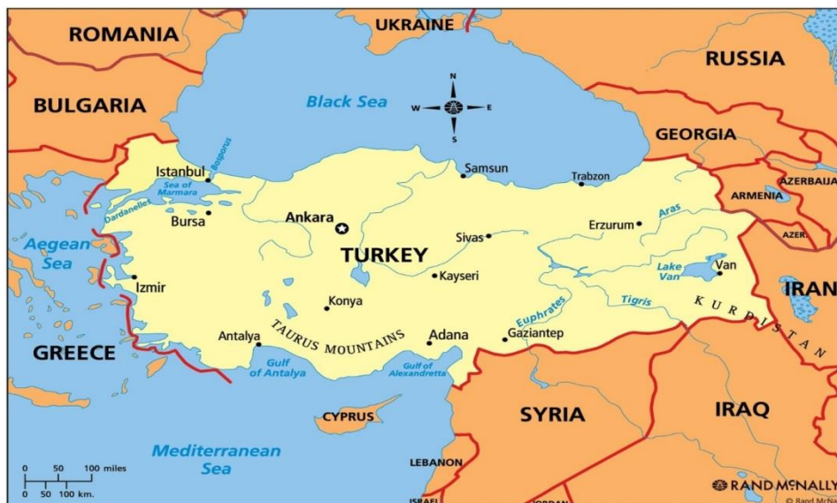
نقشه ۳: کشور ترکیه

کیلومتر و بلغارستان ۲۴۰ کیلومتر. کشور ترکیه ۸۱ استان دارد. مراکز همه استان‌ها به جز سه استان با خود استان همنام هستند. سه استان نامبرده عبارت‌اند از: ختای (مرکز: انتاکیه)، کوجالی (مرکز: ایزمیت)، سقاریه (مرکز: آداپازاری). هر کدام از استان‌های ترکیه به چندین بخش تقسیم شده‌است.