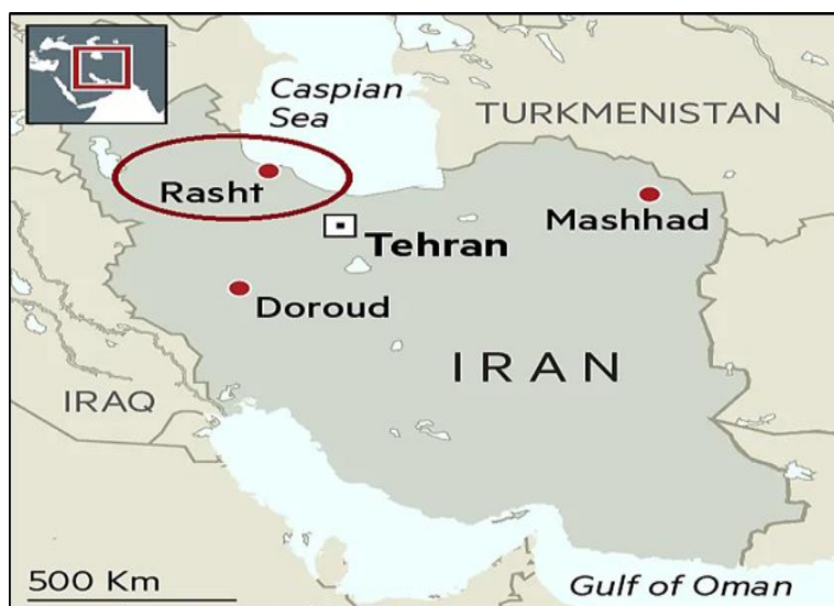
نقشه ۱- موقعیت شهر رشت

شهر رشت یکی از کلان‌شهرهای ایران و مرکز استان گیلان است، همچنین بزرگ‌ترین و پرجمعیت‌ترین شهر شمال ایران در بین سه استان حاشیه‌ای دریای خزر (مازندران، گیلان، گلستان) محسوب می‌شود. تقریباً در مرکز جلگه گیلان قرار گرفته و در طول جغرافیایی ۴۹ و ۳۵ درجه و ۳۷ و ۱۶ درجه واقع است. ارتفاع متوسط آن از سطح دریا ۸ متر است. فاصله شهر رشت تا شهر تهران ۳۲۵ کیلومتر است و مسیر تهران، رشت از شهرهای قزوین رودبار منجیل و لوشان و از کنار مهم‌ترین رود کور یعنی سفید رود گذر می‌کند. شهر رشت با وسعتی بیش از ۵۰ کیلومتر مربع بزرگ‌ترین شهر کناره دریای خزر به شمار می‌رود، شهر گیلان در جلگه گیلان و در حاشیه غربی دلتای سفید رود قرار گرفته است. آب و هوای رشت معتدل و در بعضی مواقع مه آلود است و از مناطق پرباران ایران به شمار می‌رود. متوسط درجه حرارت سالانه شهر رشت تقریباً معادل ۱۵ درجه سانتی‌گراد است و این در حالی است که حداکثر مطلق درجه حرارت تا ۳۷ درجه سانتی‌گراد و حداقل ۱۹ درجه زیر صفر نیز گزارش شده است متوسط بارندگی سالانه این شهر ۱۳۵۶ میلی‌متر است و معدل تعداد روزهای یخبندان در طول سال در حدود ۲۴ روز است.