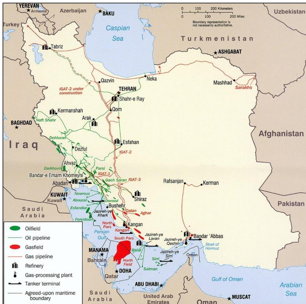
شکل ۲: برخی پتانسیل‌های ژئواکونومیک ایران

بررسی تاریخ روابط ایران و روسیه نشان می‌دهد که دو کشور در شرایط تاریخی با دیدگاه‌های متفاوت به یکدیگر نگرسته‌اند. ایران در نزد روسیه و روسیه در نزد ایران از زمانی مورد توجه خاص قرار گرفتند که پترکبیر، دکترین معروف خود را مبنی بر ضرورت دسترسی به آب‌های گرم بیان کرد. در آن زمان روسیه شروع به گسترش قلمرو خود و کشورگشایی نموده و در نزد همسایگان جنوبی به تهدیدی خطرناک و جدی و کشوری غیر قابل اعتماد تبدیل شد (باباجانی، ۱۳۹۰: ۲). آنچه مایه شکل‌گیری اولین ارتباطات دو کشور شد اهمیت ژئوپلیتیک ایران برای روسیه بوده است. این نگاه نابرابر تا دوره پهلوی دوم که ژئوپلیتیک روسیه تاندازه‌ای برای حکومت وقت مهم می‌شود، ادامه یافت؛ به طوری که می‌توان سایه سنگین مساحت، همسایگی و قدرت اتمی‌شوری را بر جهت‌گیری‌های سیاست خارجی ایران مشاهده نمود؛ اما پس از انقلاب اسلامی، سیاست خارجی جمهوری اسلامی نه بر اساس منافع ملی و برگرفته از عوامل ژئوپلیتیک خود بلکه بیشتر بر مبنای نیازهای تکنولوژیک و حمایت سیاسی روسیه از ایران شکل گرفته است؛ و بر عکس، سیاست خارجی روسیه در قبال ایران متأثر از وزن ژئوپلیتیکی خود و عوامل ژئوپلیتیکی ایران بوده است.