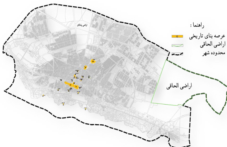
شکل (۲): توزیع فضایی جاذبه‌های گردشگری در بافت تاریخی (مهندسین مشاور آرمان شهر، ۱۳۸۸)

روش پژوهش حاضر از نظر روش توصیفی-تحلیلی و از نوع کاربردی است. روش گردآوری اطلاعات به صورت کتابخانه‌ای و میدانی است، پرسشنامه حاوی ۸ شاخص اجتماعی: امنیت، مشارکت، حس تعلق، تعاملات اجتماعی، خاطره‌انگیزی، آگاهی، وابستگی به مکان، انسجام و همبستگی و در ۴۰ گویه را نشان می‌دهد. جهت تجزیه و تحلیل