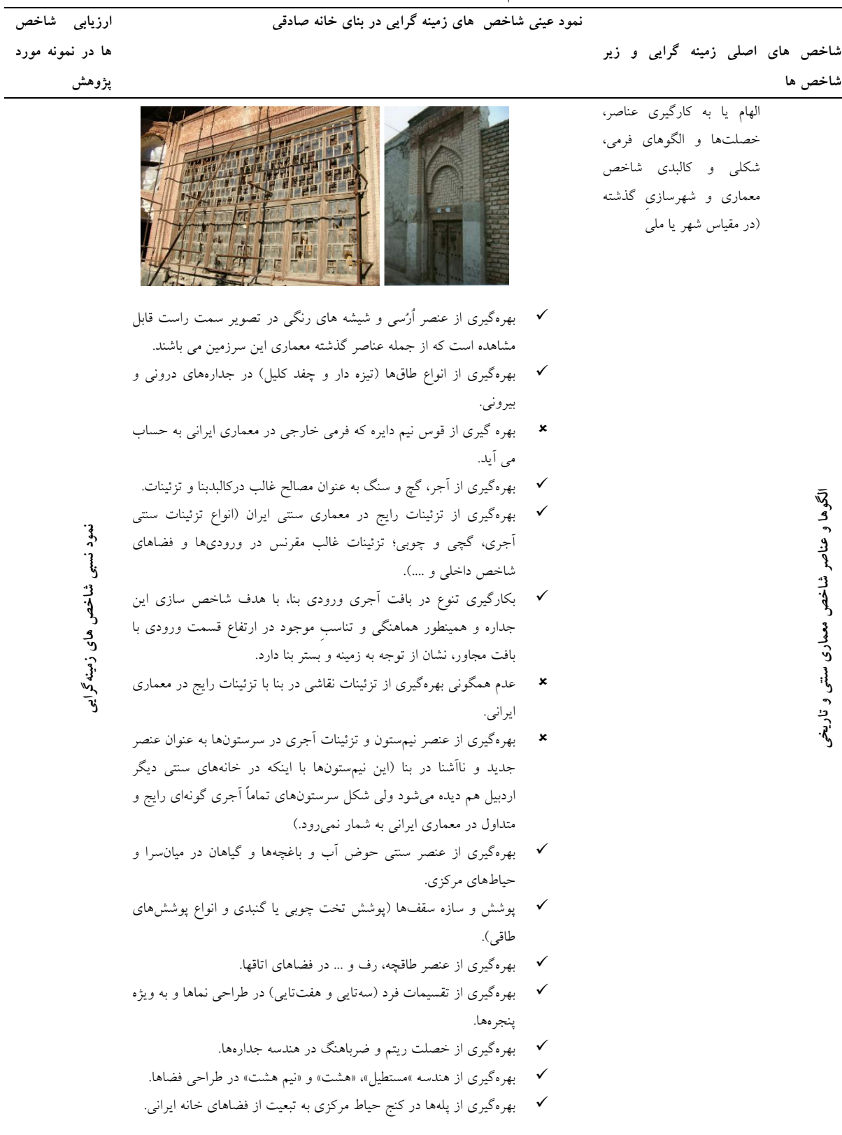
جدول ۳-ارزیابی کیفیات مستقیم معماری و شهرسازی در خانه صادقی اردبیل