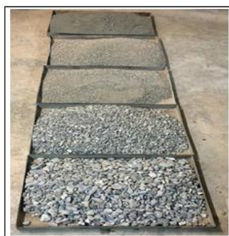
شکل ۱. رسوبات الک شده در اندازه های متفاوت جهت آماده سازی طرح اختلاط (اندازه سینی ها ۶۰×۳۰ سانتی متر)

در این پژوهش خصوصیات بافتی رسوبات آبرفتی رودخانه دامن و تأثیر آن بر خصوصیات مهندسی بتن تهیه شده از آن ارزیابی شد. سپس با افزودن برگ های درختچه داز در تیمارهای مختلف، خصوصیات بتن مانند مقاومت بتن با ساخت نمونه های استوانه ای مورد ارزیابی قرار گرفت. رسوبات رودخانه دامن عمدتاً از قطعات شیل، سیلتستون، کنگلومرا، ماسه سنگ، کوارتز، قطعات کربناته، قطعات سنگ بازالت و داسیت تشکیل شده است. نمونه های استوانه ای از درصدهای مختلف برگ ساخته شده و مقاومت بتن مورد آزمایش قرار گرفت. پانزده نمونه از رسوبات رودخانه ای برای مطالعات بافتی نمونه برداری شد. پنج نمونه در حجم ۵۰ کیلوگرم گرفته شد و برای ساخت بتن مورد استفاده قرار گرفت. نمونه های درختچه داز از حاشیه و متن رودخانه برداشت شد. آب مورد استفاده در ساخت و فرآوری بتن، آب آشامیدنی است که برای بتن مشکلی ایجاد نمی کند. سنگدانه های رسوبات رودخانه در منطقه دامن از نوع گرد گوشه است که پس از غربال کردن آنها به اندازه های مختلف تقسیم و جهت آماده نمودن طرح اختلاط در سینی های جداگانه آماده سازی شدند. (شکل ۱)