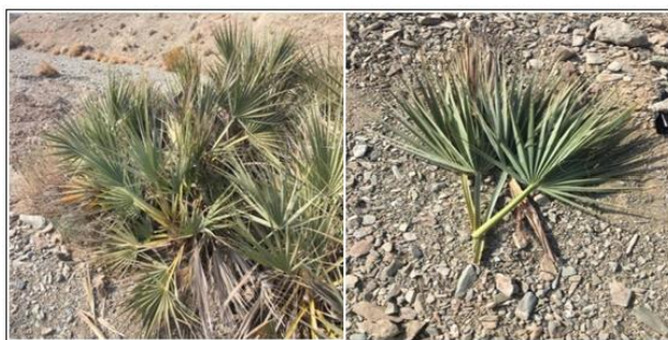
شکل ۲. درختچه های داز در متن و حاشیه رودخانه