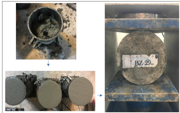
شکل ۳. مراحل ساخت نمونه بتن و تست برزیلی

مقاومت کششی بتن یکی از مهمترین خصوصیات است که تاثیر زیادی در ایجاد و باز شدن ترک‌های بتن دارد. مقاومت کششی بتن اغلب با استفاده از آزمون شکافت نمونه استوانه‌ای یا تست برزیلی بدست می‌آید. شکل (۳).