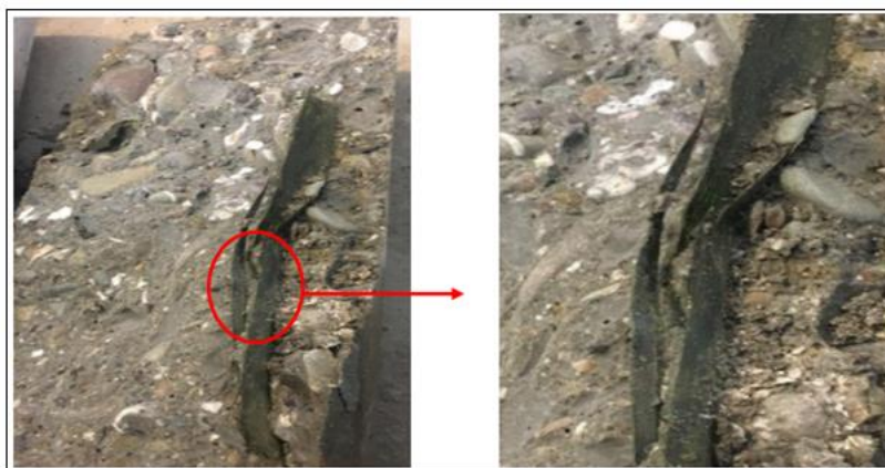
شکل ۵. نمونه بتن استوانه ای پس از وارد کردن فشار و گسیخته شدن برگ های موجود در بتن

نمونه شاهد بدون برگ ساخته شد، با فشار ۹ مگاپاسکال تخریب شد، نمونه ساخته شده با یک رشته برگ با فشار ۹٫۵ مگاپاسکال شکسته شد و نمونه دو رشته ای برگ با فشار ۱۰٫۱ مگاپاسکال شکسته شد و در پایان، کمترین مقاومت مربوط به بتن ساخته شده از تعداد سه لایه ای برگ بود که با فشار حداکثر ۵٫۱ مگاپاسکال تخریب شد. در نمودار بار اعمال شده بر روی نمونه های بتنی شکل (۵). در ابتدا روند افزایشی مقاومت کششی دیده می‌شود، پس از آن استحکام کششی کاهش می‌یابد. به عبارت دیگر، افزایش تعداد برگ‌ها توسط سه لایه باعث کاهش قابل توجه مقاومت کششی بتن شده است. بیشترین مقاومت کششی مربوط به نمونه ۳ است که از دو لایه برگ تشکیل شده است.