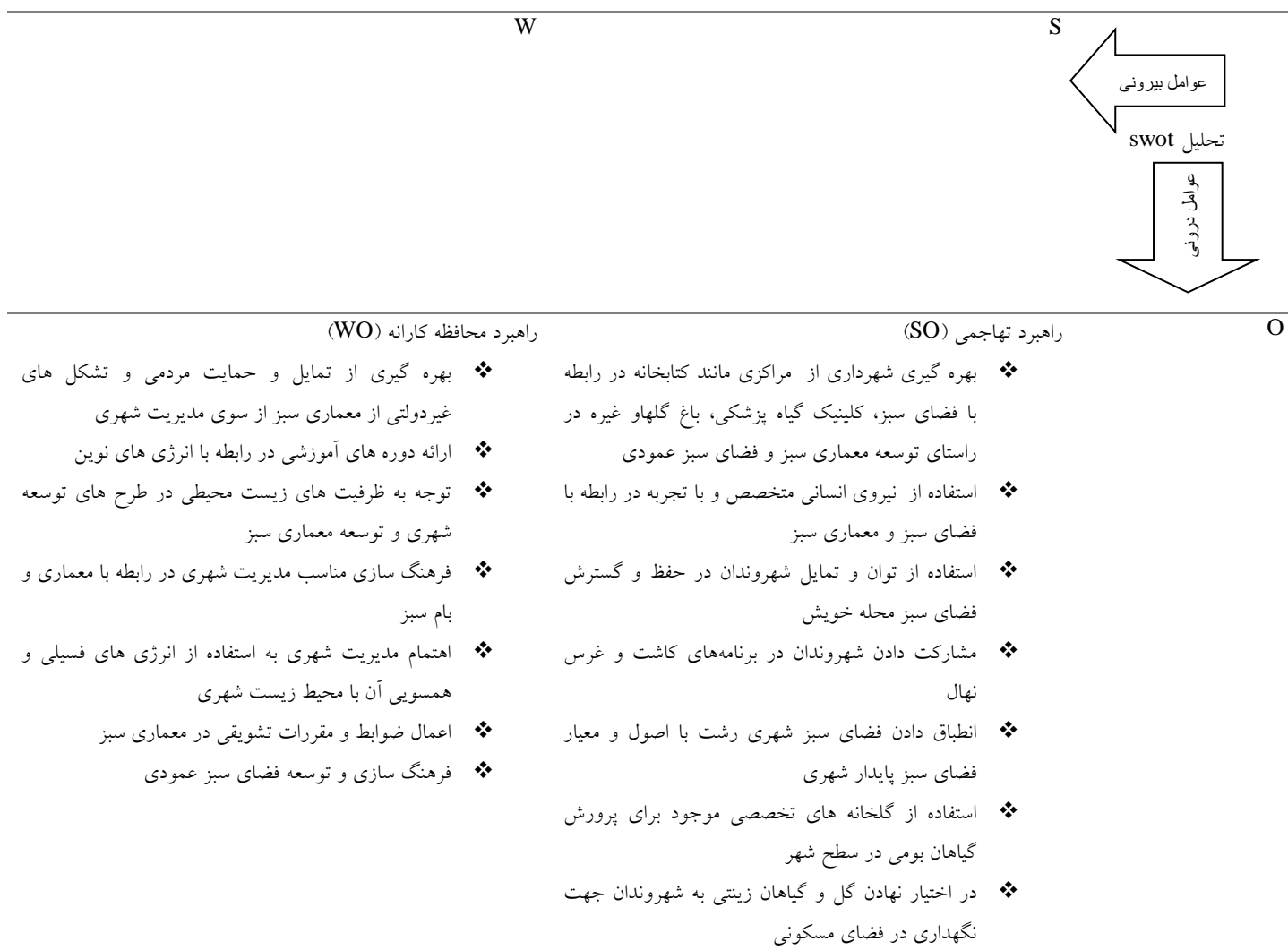
جدول ۵: تحلیل راهبردهای سوات

قرار می دهند. استخراج راهبردهای ممکن از طریق ماتریسی که از تقابل و تعامل عوامل درونی و بیرونی شکل می یابد، صورت می گیرد. این ماتریس در جدول (۵) ارائه شده است.