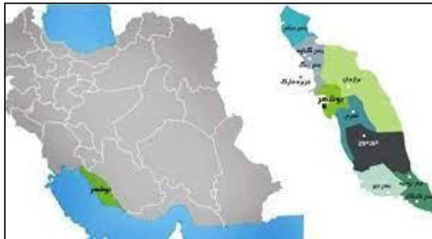
شکل ۲: موقعیت استان و شهر بوشهر

استان کهگیلویه و بویراحمد، از شرق به قسمت وسیعی از استان فارس، از جنوب و غرب به خلیج فارس و از جنوب شرق به قسمت کوچکی از استان هرمزگان مرتبط است. این استان با مساحتی حدود ۲۷۰۶۵۳ کیلومتر مربع، جمعیتی برابر ۱۰۱۶۳۰۴۰۰ نفر دارد. [۱۲] استان بوشهر با خلیج فارس بیش از ۷۰۷ کیلومتر مرز دریایی دارد. استان بوشهر میان ۲۷ درجه و ۱۹ دقیقه تا ۳۰ درجه و ۱۶ دقیقه عرض شمالی و ۵۰ درجه و ۱ دقیقه تا ۵۲ درجه و ۵۹ دقیقه طول شرقی از نصف‌النهار گرینویچ قرار دارد.