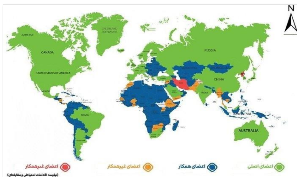
شکل ۱. پراکنندگی جغرافیایی اعضای گروه ویژه اقدام مالی رژیم بین‌المللی مقابله با

استانداردها هستند اما عضو اصلی این نهاد نیستند و دو دسته آخر، کشورهایی هستند که با گروه ویژه اقدام مالی همکاری مناسبی ندارند و از نظر FATF دارای ریسک بالا در زمینه پولشویی و تأمین مالی تروریسم هستند. این کشورها خود به دو دسته متفاوت تقسیم می‌شوند و فقط علیه یک دسته از این کشورها «اقدام مقابله‌ای (Counter Measure)» انجام می‌شود. به عبارت دیگر FATF درخصوص این کشورها از اعضای خود درخواست می‌کند تا اقدامات متقابل مؤثر در بند ۱۹ توصیه‌نامه را اجرایی کنند. این بند تصریح می‌کند: «در صورتی که گروه ویژه کشوری را با ریسک بالا اعلام کند، کشورها باید بتوانند اقدامات متناسب با ریسک بالاتر را نسبت به آن کشور انجام دهند» (United Nations Global Counter Terrorism Strategy, 2016) در حال حاضر بر اساس آخرین بیانیه FATF در ۲۱ فوریه ۲۰۲۱، فقط ۱۶ کشور از جمله آلبانی، باهاماس، باربادوس، بوتسوانا، کامبوج، غنا، جامائیکا، موریس، میانمار، نیکاراگوئه، پاکستان، پاناما، سوریه، اوگاندا، یمن و زمبابوه در زمره کشورهای عدم همکاری گروه ویژه اقدام مالی قرار دارند. اما وضعیت ایران به همراه کره شمالی از کشورهای نامبرده نیز نامناسب‌تر است و تنها این دو کشور در لیست اقدامات مقابله‌ای قرار دارند. در تصویر زیر، وضعیت همه کشورهای جهان از منظر تعامل با گروه ویژه اقدام مالی نمایش داده شده است (شکل ۱).