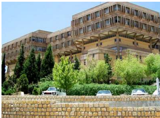
شکل ۴. دانشگاه شیراز