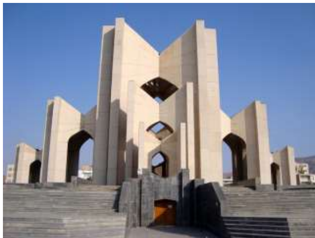
شکل ۱. تصویر مقبره الشعراى تبریز