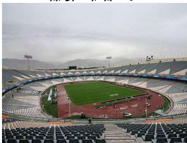
شکل ۲. ورزشگاه آزادی تهران