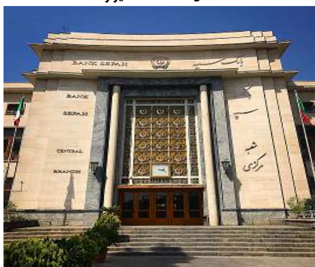
شکل ۵. بانک سپه