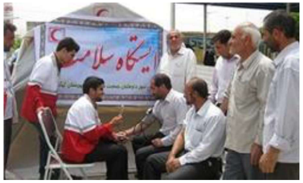
تصویر شماره ۲-۹ – ایستگاه سلامت شهروندان و اطلاع رسانی بهداشتی