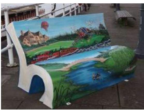
تصویر راست ۲-۷-آموزش تاریخ. لندن. نمونهای از نیمکتهایی که تصاویری از داستانهای معروف این کشور را به نمایش میگذارد.

در اقدام دیگری می توان از فعالیت خیمه های اطلاع رسانی در جهت آموزش دهندگی فضا با مشارکت خود شهروندان سود جست. از این خیمه ها در ارتباط با آموزش های زیست محیطی، بهداشت و سلامتی، اشاعه صلح و نوع دوستی استفاده می شود.