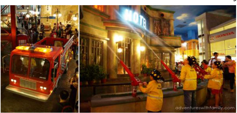
تصویر شماره ۲-۲ -کید زانیا. کودکان در حال آموزش خاموش کردن آتش

ایده شهر آموزشی برای کودکان توسط خاویرلوپزآنکونا که یک مکزیکی کارآفرین بود و علاقه شدیدی به آموزش و سرگرمی کودکان داشت مطرح شد و در سال ۱۹۹۹ در سنتافه مکزیک اولین شهر کودکان را افتتاح کرد (امیر جلیلی نژاد) کیدزانیا یا شهر آموزشی برای کودکان مجموعهای میباشد که در آن تعدادی زیادی ساختمان و مغازه و جود دارد که در هر ساختمان و مغازه، شغل مربوط به آنجا به بچهها آموزش داده می شود و بچهها میتونند که هر شغلی رو که دوست دارند رو در اینجا شخصاً تجربه کنند و یک سری آموزشهای ابتدایی آن شغل را در این مکان ببینند. در این مجموعه بچهها میتونند بیش از ۸۰ شغل دنیا رو در اینجا تجربه کنند که این شغلها مثل خلبانی با بوئینگ ۱۷۳۷ و دندانپزشکی و روزنامه نگاری و آتش نشانی و دامپزشکی و .... است. در این مجموعه بچهها میتونند بدون حضور پدر یا مادر برای ساعتها شخصاً و با پوشیدن لباسهای مخصوص هر شغل در ایس مجموعه مشغول فراگیری و بازی شوند.