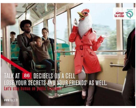
تصویر شماره ۲-۶ –چپ: در فضای عمومی نباید با تلفن بلند صحبت کنید.