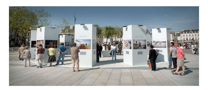
تصویر شماره ۲-۳- نمونههای نمایشگاههای فضای باز موقت