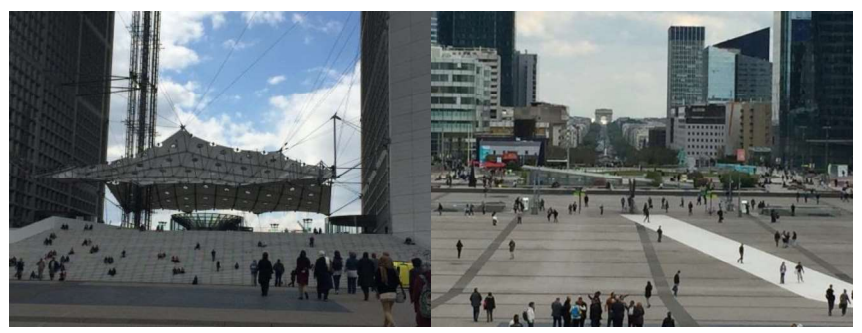
تصاویر شماره ۲-۱ و ۲-۲: میدان شهری محل تجمع و تعاملات اجتماعی در پاریس محله لدفانس

شهر آموزشدهنده به شهروندانش امکان برای یادگیری میدهد. فضایی که به روی آنها باز است. مثلاً یک میدان، جایی که آنها می توانند با یکدیگر ملاقات و تبادل نظر کنند. این در حقیقت همان تصویر کلاسیکی از دموکراسی یونانی در ۵۰۰ سال قبل از میلاد است. فضایی که مردم می توانند تبادل عقاید و اخبار کنند. به تعبیری همان «فوروم» است. با کارکرد یک اتاق سمینار با موضوع آزاد و گفتگوی آزاد. شهر آموزش دهنده باید فضاهایی برای ملاقات افراد ایجاد کنند – که هر فرد دانستههای خود را برای تبادل با دیگران همراه می آورد.