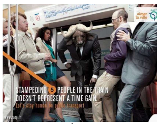
تصویر شماره ۲–۵ —راست: این عکس که در متروی شهر پاریس نصب شده قصد آموزش این مطلب را دارد که اجازه بدید اول کسانی که قصد پیاده شدن را دارند، پیاده شوند بعد شما وارد شوید.

شهر فضایی گسترده و رسانهای چندگانه است که می تواند آموزشها رسمی، غیررسمی، فضایی، غیرمستقیم، مستقیم و ...در آن صورت پذیرد. مفاهیم آموزشی قابل انتقال از طریق رسانهای به چنین گستردگی و پویایی می تواند بازه وسیعی را شامل شود. دستهای از رسانههای محیطی هستند که صرفاً جهت نمایش و انتقال مفاهیم خاص و هدفمند طراحی می شوند. در این گروه از مبلمان شهری نه تنها زیبایی و شکیل بودن نرم و تناسب اندازه آن ومکان یابی مناسب این رسانهها مدنظر است. بلکه محتوای آنها و چگونگی و تناسب محتوا و رسانه محیطی نیز اهمیت و یژهای می یابد. در فرانسه و آلمان رسانه محیطی آشکارا در جهت آموزش شهروندان قدم برداشته اند.