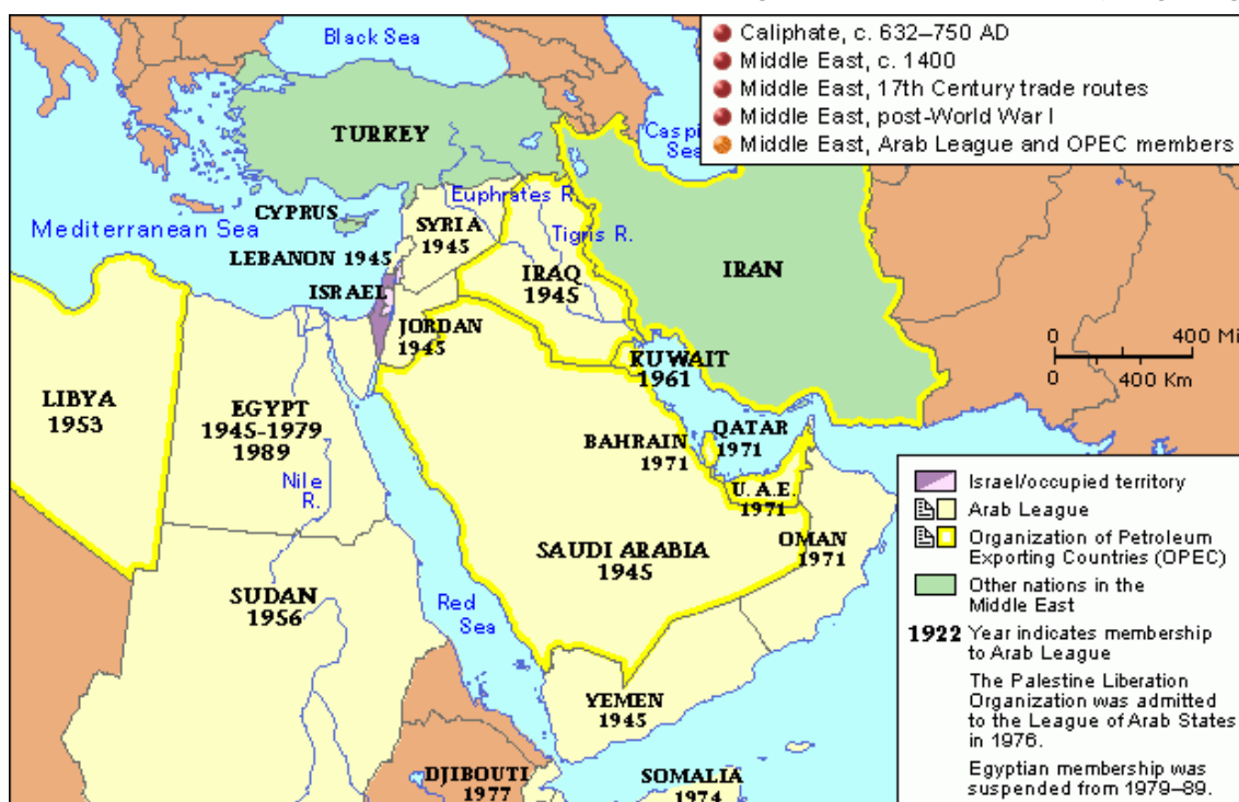
نقشه ۱- منطقه غرب آسیا

جدید مربوط به منطقه را باید در یک گستره وسیع به نام غرب آسیا بررسی کرد. گرچه (منطقه غرب آسیا) خاورمیانه کانون پیدایش سه کیش بزرگ اسلام، مسیحیت و یهود بوده است، اما فرهنگ مردم در خاورمیانه بر معتقدات اسلام بنیان نهاده شده است. موقعیت منحصر به فرد جغرافیایی، (منطقه غرب آسیا) خاورمیانه را به منطقه‌ای استراتژیک تبدیل کرده است زیرا این قلمرو در مرکز سه قاره آسیا، اروپا و آفریقا قرار گرفته و کوتاه‌ترین راه‌های هوایی و آبی اروپا و آسیا از این منطقه عبور می‌کنند (اطاعات، ۱۳۷۵، ۶۰).