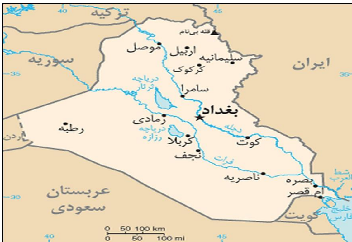
نقشه شماره ۲- کشور عراق

بخش بزرگ عراق صحرا است اما مناطق مابین دو رود دجله و فرات حاصل خیز است. این رودها سالانه ۶۰ میلیون متر مکعب لای را به دلتا حمل می‌کنند. قسمت‌های شمالی کشور عمدتاً کوهستانی است و بلندترین قله آن حاجی عمران (شیخا دار) (هم‌مرز با بلندی‌های پیرانشهر ایران) با ارتفاع ۳۶۱۱ متر است. عراق مرز ساحلی کوچکی به طول ۵۸ کیلومتر با خلیج فارس دارد. در مجاورت شط العرب که نزد ایرانیان با نام اروند رود شناخته می‌شود، مرداب‌هایی قرار داشتند که بیشترشان طی دهه ۱۳۷۰ خشکانده شدند. آب و هوای کشور (به جز شمال) عمدتاً صحرايي است با زمستان‌های خنک و گاه سرد و تابستان‌های خشک و گرم و آفتابی. دمای هوا در تابستان در بیشتر جاهای این کشور به ۴۰ درجه سانتیگراد و در برخی مناطق به ۴۸ درجه می‌رسد.