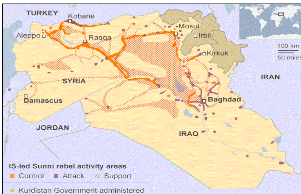
نقشه ۲- حضور گروه‌های تروریست در عراق (اطلس شیعه)

آرانی و زرین، ۱۳۹۵، ۱۲۷)؛ اما باید توجه داشت که در سال ۲۰۱۷ بیش از هر زمان دیگری بحث آینده داعش در منطقه غرب آسیا و به‌طور خاص کشورهای عراق و سوریه مطرح بود. به‌طور حتم آنچه نمایان است و همگان بر آن اتفاق نظر داشتند، این است که پایان قلمرو داعش در عراق و سوریه به معنای پایان حیات این گروه تروریستی نخواهد بود و نیروهای وابسته به این گروه تروریستی در قالبی جدید به حیات خود ادامه خواهند داد (پرتو، ۱۳۹۶). با این حال باید توجه داشت که تروریسم به تنهایی محصول هیچ گروه و کشوری نیست و آنچه سبب بروز و ظهور یک گروه تروریستی مانند داعش در عراق و سوریه شده بود وجود درگیری‌های حل‌نشده داخلی و خارجی بر سر قدرت و قلمرو آن در منطقه‌ای است؛ که هم‌اکنون نیز غرق در پول نفت، اسلحه و تفکرات افراطی و شبه‌جهادی است که خواهی یا نخواهی بسترهای مناسبی برای تشدید فعالیت‌های تروریستی محسوب می‌شوند. حال با توجه به این چالش‌ها آینده گروه‌های تروریستی و بخصوص داعش در عراق پیش رو است و سیاست‌های متأثر از تحولات آینده داعش در عراق چگونه به آن پرداخته می‌شود (طارمی، ۱۳۹۴، ۱۷۱ - ۲۱۳).