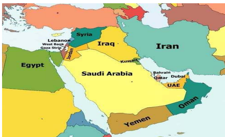
نقشه شماره (۱) موقعیت جغرافیایی عراق در خاورمیانه

کشور عراق با وسعت ۴۳۷۰۷۲ کیلومتر مربع، در جنوب غربی آسیا و در منطقه حساس خاورمیانه واقع شده است (سازمان جغرافیایی نیرو های مسلح، ۳، ۱۳۸۲). با فروپاشی امپراتوری عثمانی در جریان جنگ جهانی اول، دولت های مختلفی در خاورمیانه نظیر عراق، سوریه، لبنان، اردن، فلسطین پدیدار گردید. شکل‌گیری عراق در پی قرارداد سایکس-پیکو در سال ۱۹۱۶ بین وزرای خارجه انگلستان و فرانسه بوجود آمد. ( http://www.haw2ah.net ).